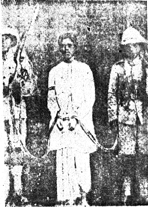
भुसावल बम काण्ड में बन्दी माहौर जी

स्थापित देश की चिन्ता के, पावन प्रतीक, बन्दन तेरा, बलिपथ की पावक शरस्परा, की दृष्ट लीक, बन्दन तेरा। विप्लव के जन्मद शंखनाद, पीड़ा प्रभाव, बन्दन तेरा। योधन के द्रुव संकल्पों की, मार्था सटीक, बन्दन तेरा।